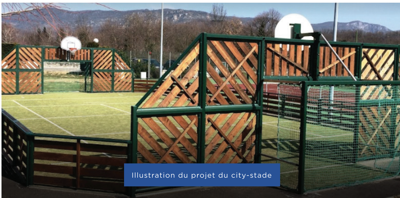
Illustration du projet du city-stade